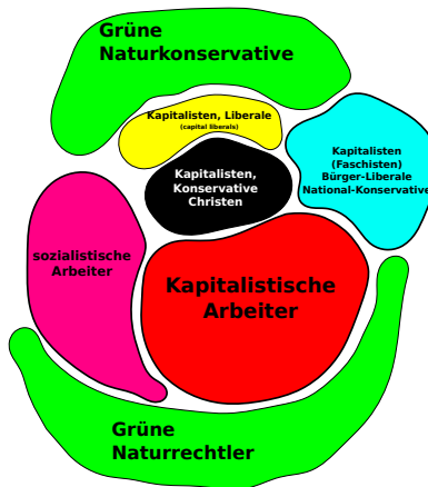
Abbildung 4: Man muss ein bisschen vorsichtig sein bei der Interpretation dieses Bildes. Die relative Lage der Fraktionen zueinander hat in zwei Dimensionen (wie auf dem Bild) nur eine eindimensionale „Berührfläche“. Tatsächlich ist der Raum der Werte, welche die Fraktionen abdecken, ein sehr hoch oder sogar \infty - dimensionaler Raum, wodurch die Fraktionen noch mehr ebenso hochdimensionale Berührflächen (Wertnegationen / Spaltungen) haben.

teilen sich weiter in Christ-konservative Kapitalisten (CDU, Republikaner in den USA , „ Tories im vereinigten Königreich “ Les Républicains in Frankreich , usw...) und Kapital-Liberale (z.B. die FDP ). Hinter der christlichen Fassade der CDU und auch hinter der FDP verstecken sich, nach wie vor die Kapitaliten des Landes. Die Werte der Kapitalisten sind Sparsamkeit, Genügsamkeit, Fleiß, Leistungsbereitschaft, Berechenbarkeit und Ordnungsauffinität (siehe Zins-induziertes Verhalten )