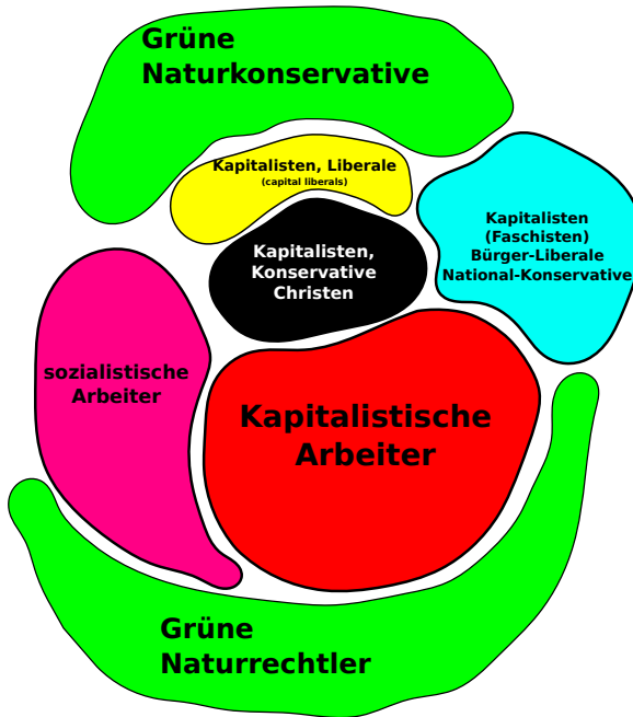
Abbildung 1: Fraktionen im politischen Spektrum, deren Grenzen in logischen Widersprüchen bestehen.