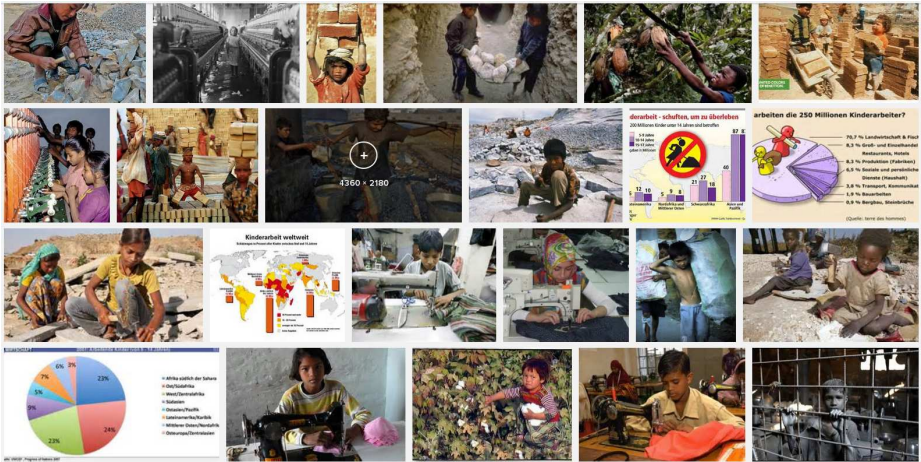
Abbildung 2: 1. u. 2. v. oben: Phasen der Bevölkerungs-Entwicklung. 3. v. oben Das Phänomen der Kinder-Arbeit. Die wohl schlimmste Form der Heteronomie ist der Kindes-Missbrauch. Unten: Ein Teil der Geschichte der Menschheit und die letzten 500 Jahre: das Anthropozän .

http://www.oekosystem-erde.de/html/bilder/bevoelkerung-industrie.gif