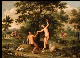
Abbildung 2: Der Sündenfall vor über 6.000 Jahren: Die Entdeckung des Zinsmechanismus.