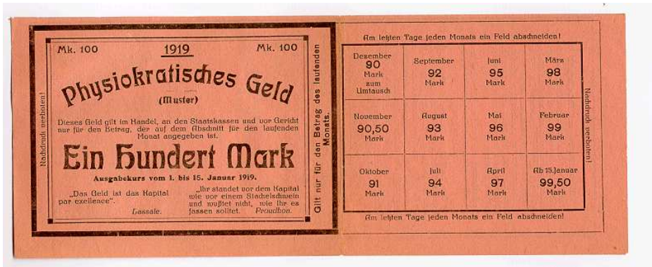
Abbildung 1: Physiokratisches Geld von 1919, sog. „Schwundgeld“. Aus dem gleichen Jahr stammt der Aufruf des NS-Ökonomen Gottfried Feder mit dem Titel Manifest zur Brechung der Zinsknechtschaft .

nen durch das Bankensystem der Host-Währung zu entfliehen. Das Gesicht auf den „Krypto-Münzen“ ist ein anonymes Gesicht menschlicher Abgründe. Was ist der Zins der Kryptowährungen, und was bewirkt man, wenn man Einheiten der Host-Währung z.B. € für Bitcoin und Co hergibt?