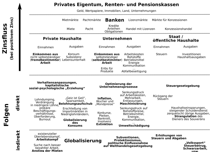
Abbildung 1: Der Kaiser ist nackt: Zinsflüsse und Wirkungen im Detail.

Entscheidend ist letztlich, dass der Zinsfluss und die dem zugeordneten Wirkungen nachvollzogen werden können, damit die Leute von sich aus kapieren, was der positive Zins bewirkt.