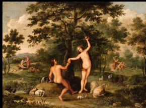
Abbildung 1: Der Sündenfall: Die Entdeckung des Zinses durch den Menschen vor 6.000-13.000 Jahren. Zitat aus einem Artikel der FAZ: „Es gibt zwischen den ältesten Sprachen der Menschheit eine interessante Parallele. Die Sumerer, die etwa 3000 Jahre vor Christi Geburt Mesopotamien (also in etwa die Gegend des heutigen Iraks) bevölkerten, kannten bereits ein Wort für Zins: Es hieß in ihrer Sprache mash, und es bedeutete gleichzeitig „Kalb“. Die Griechen sprachen von tokos, was zugleich „junges Rind“ hieß. Und die Ägypter sagten ms, was auch „Leben geben“ bedeutete.“. Der ganze Artikel ist hier .

System über Höhe, Belastete und Begünstigte entschiede, plädiere ich für negative Zinsen auf Guthaben und Kredite, also das logische Gegenteil des kapitalistischen Prinzips , Wirtschaft zu finanzieren.